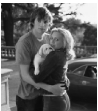
Sessão da Tarde: Recém-Casados