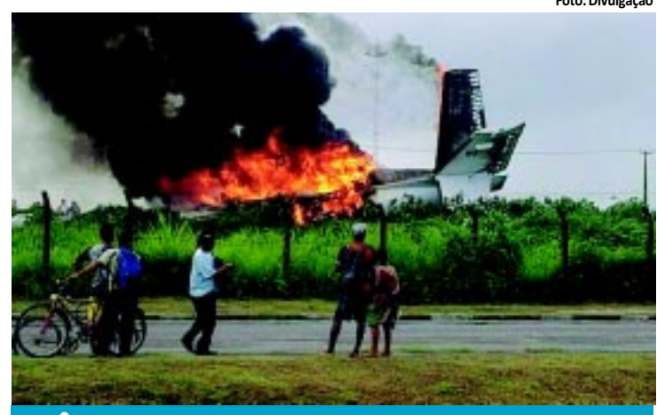
País bate recorde em acidentes aéreos

politana de João Pessoa (RM-JP). Desde o início do ano já foram registradas 1.930 denúncias. Durante 2011, foram 7.882. Bairros da Zona Sul lideram ranking de ocorrências. PÁGINA 9