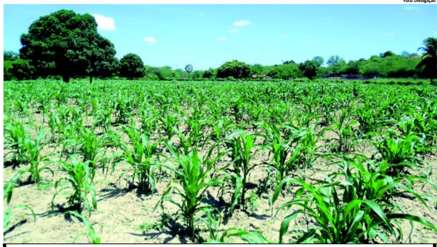
Segundo a Conab, o milho é a cultura de maior representação da safra 2011/12 e pode chegar a 111,6 mil toneladas

dual de Bancos de Semente Comunitárias deverá distribuir em todo o Estado 920 toneladas de milho e feijão, beneficiando mais de 83 mil famílias de agricultores inscritos. PÁGINA 12