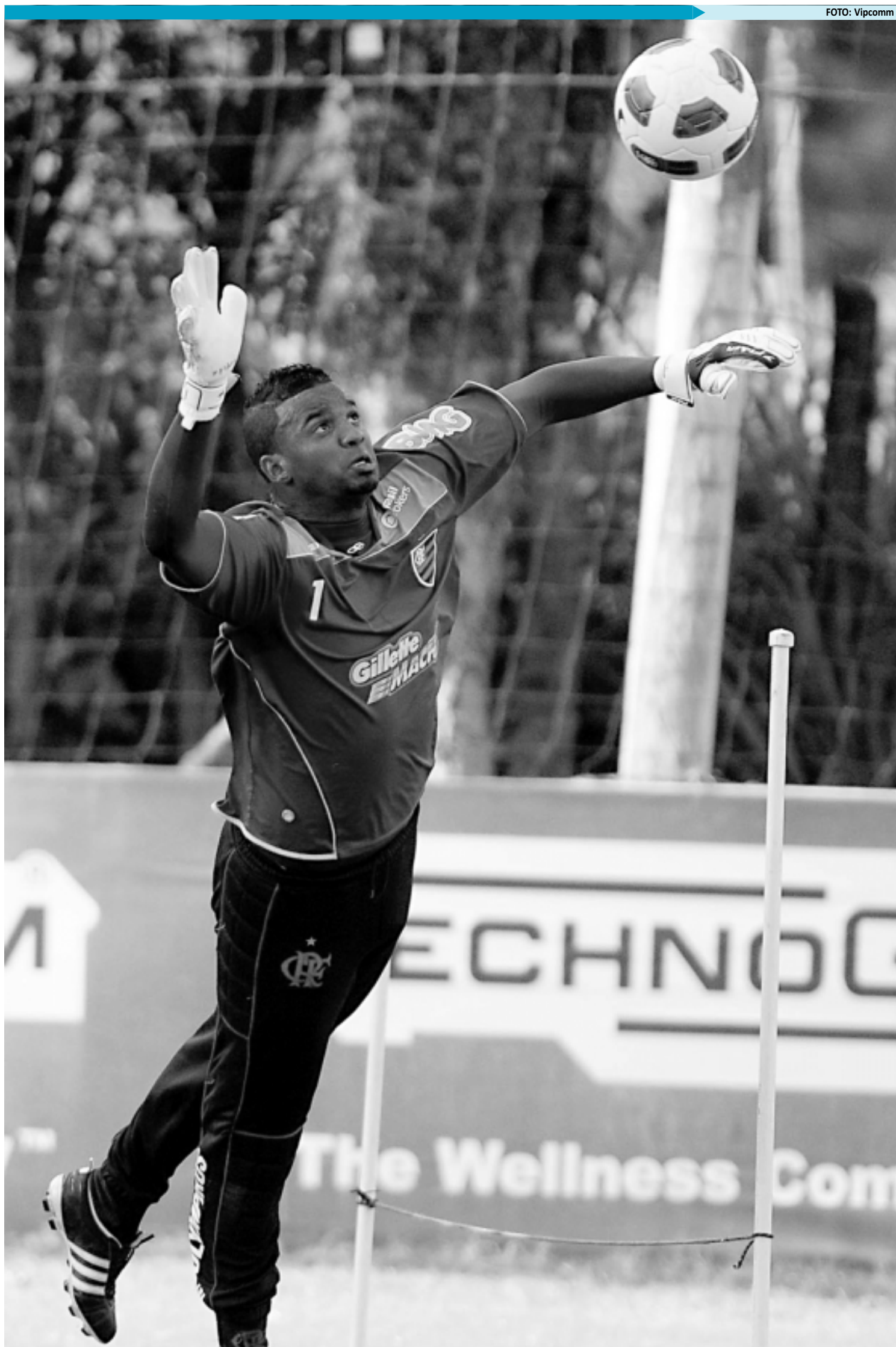
O goleiro do Flamengo deixou o campo transtornado e elencou os erros do árbitro Felipe Gomes da Silva na derrota de 2 a 1 para o Boavista

O Flamengo volta a campo no domingo, quando enfrenta o Duque de Caxias, fora de casa, pela segunda rodada da Taça Rio. A equipe, que chegou até a semifinal do primeiro turno, já é a lanterna do grupo A.