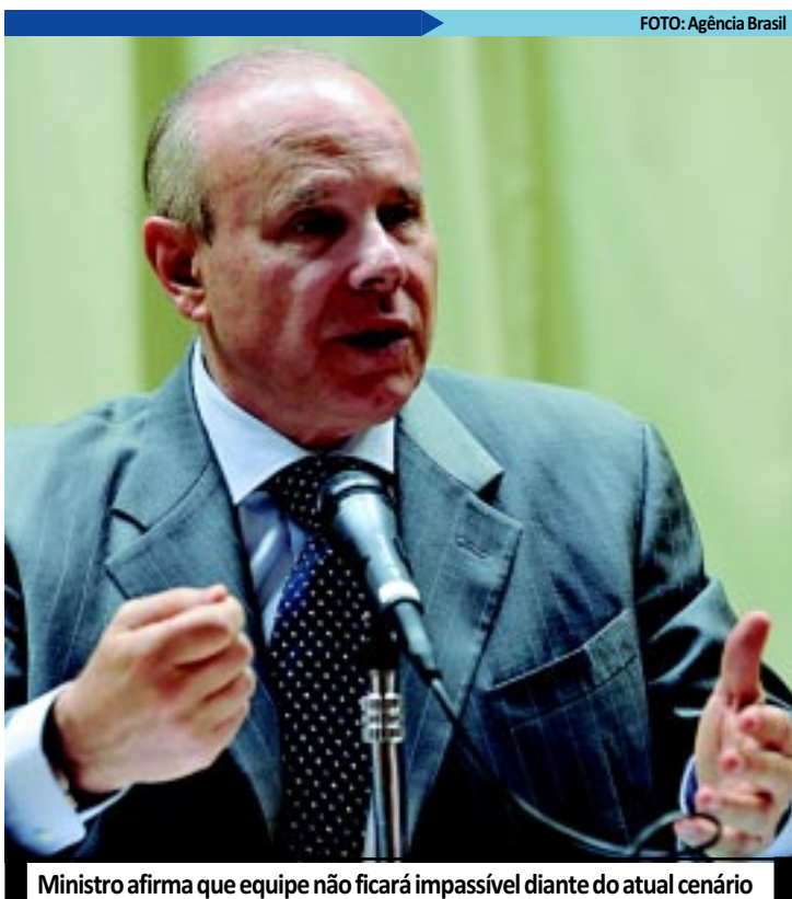
Ministro afirma que equipe não ficará impassível diante do atual cenário

O Decreto 7.683, publicado ontem no Diário Oficial da União, altera o prazo de dois para três anos da cobrança de 6% do Imposto sobre Operações Financeiras (IOF) nas liquidações de operações de câmbio contratadas a partir de 1º de março de 2012, para ingresso de recursos no país. Na última quarta-feira, o Banco Central (BC) teve que intervir mais uma vez no mercado para evitar que o dólar ficasse próximo de R$ 1,70. Com a forte entrada de dólares no país e a consequente queda da moeda, ontem o BC fez dois tipos de operação: uma de compra de dólares no mercado à vista e outra equivalente à compra no mercado futuro.