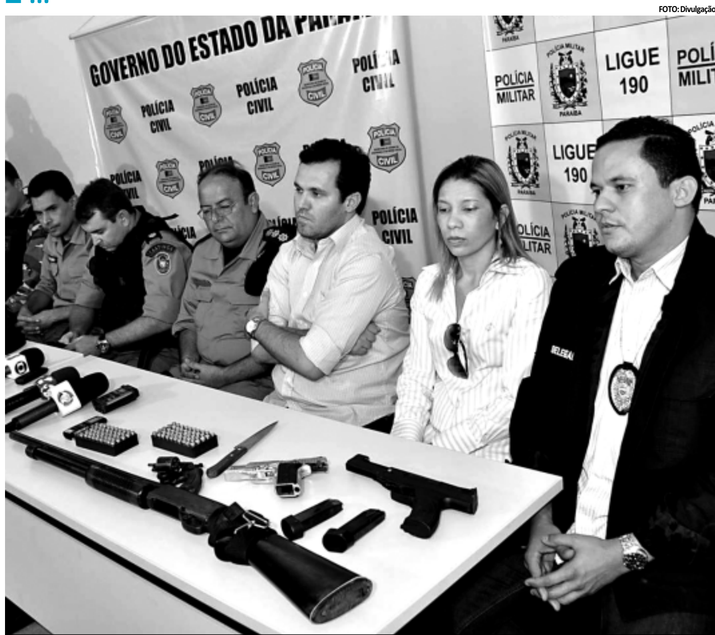
Irmãos envolvidos nos crimes de estupro e morte em Queimadas podem ter bens bloqueados pela Justiça, na próxima semana