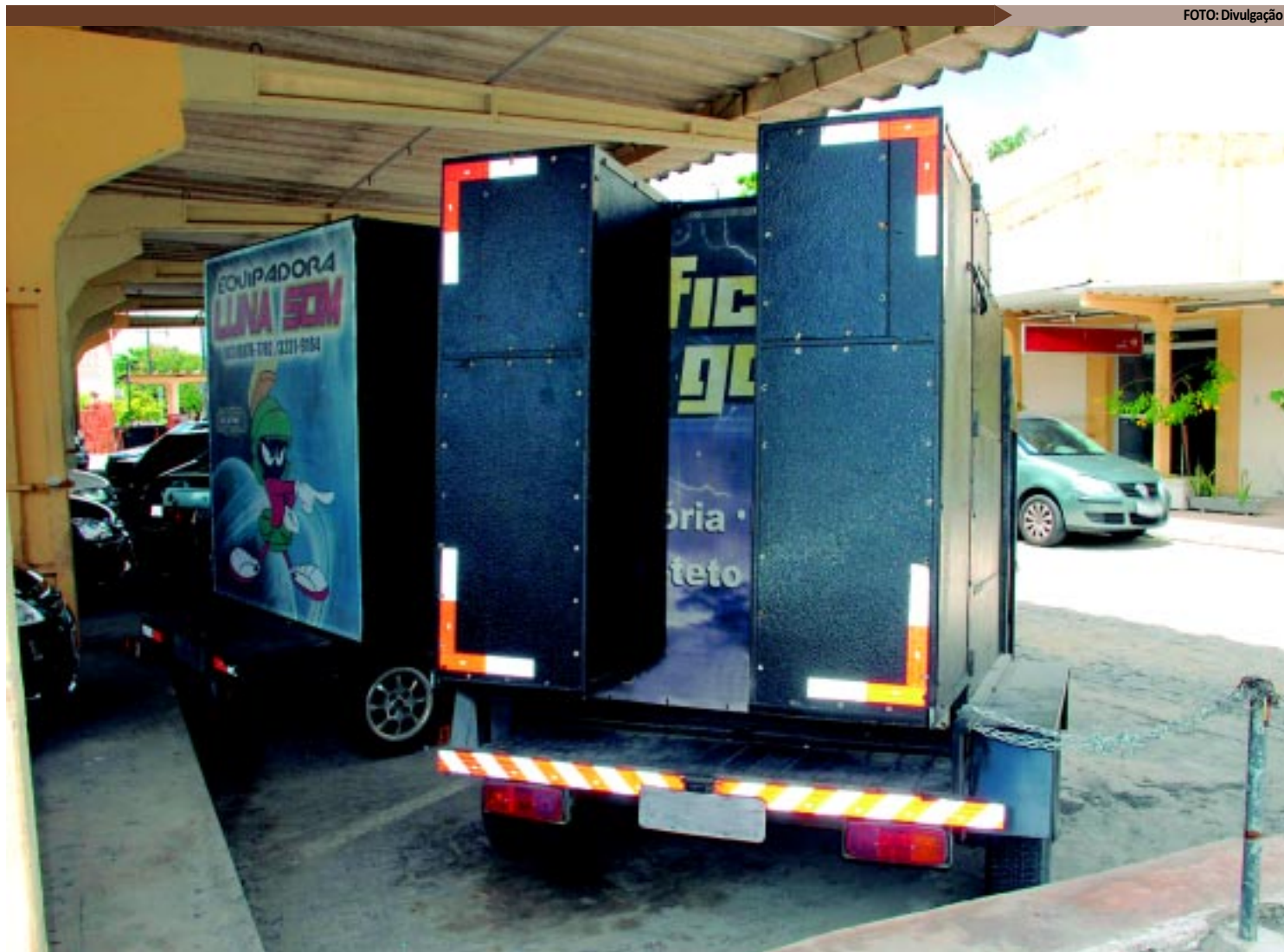
Em bares e comércios, durante o dia o limite de som permitido é de 65 decibéis; à noite, de 55 decibéis. O mesmo se aplica aos carros de som

cretaria de Meio Ambiente - Semam, em 2011 foram registradas em João Pessoa 7 mil 882 denúncias de poluição sonora. Neste ano, até agora, as denúncias referentes a este crime ambiental já somam 1.930. Os bairros com maior registro de denúncias de poluição sonora são: Mangabeira (58%), Va-