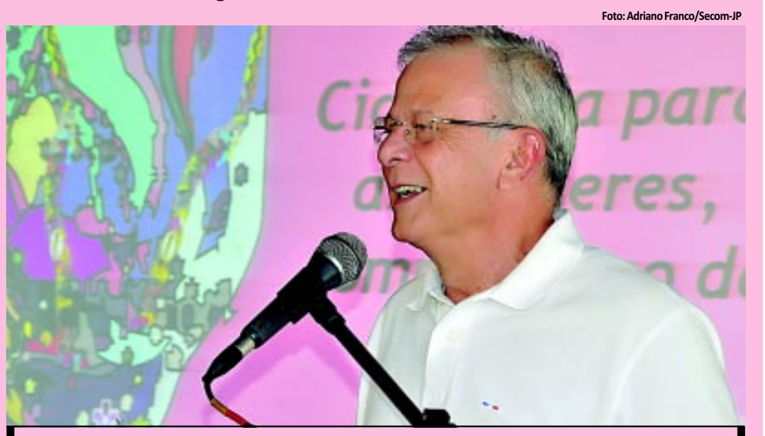
Prefeito da Capital destacou a necessidade de se promover a paz e proteção à vida

A Prefeitura de João Pessoa lançou ontem a campanha do Mês da Cidadania Ativa para as Mulheres, em homenagem ao Dia Internacional da Mulher (8 de março). Um dos principais focos desse evento é o enfrentamento à violência contra elas, uma vez que só no mês de fevereiro deste ano, 18 mulheres foram assassinadas. Duas delas, anteontem. PÁGINA 9