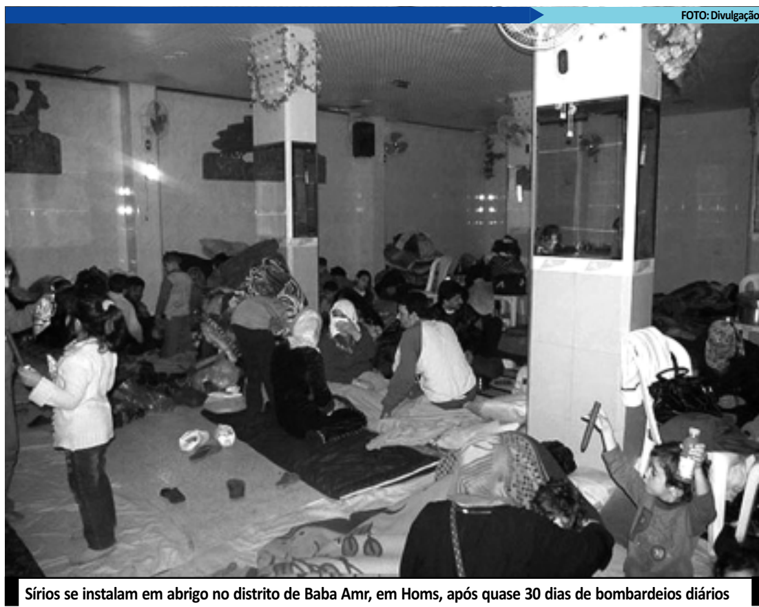
Sírios se instalam em abrigo no distrito de Baba Amr, em Homs, após quase 30 dias de bombardeios diários

No comunicado, o grupo disse que a decisão foi tomada para poupar cerca de 4.000 habitantes que insistem em permanecer em suas casas. Eles ameaçaram o exército do governo caso este cometa ataques "de vingança" contra alvos civis.