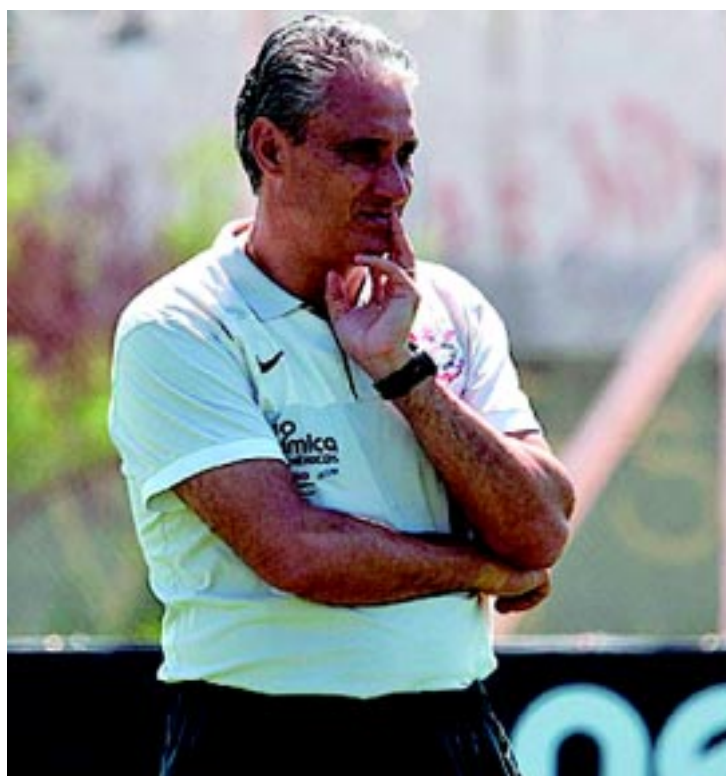
Tite disse que os jogadores souberam controlar o jogo na vitória suada