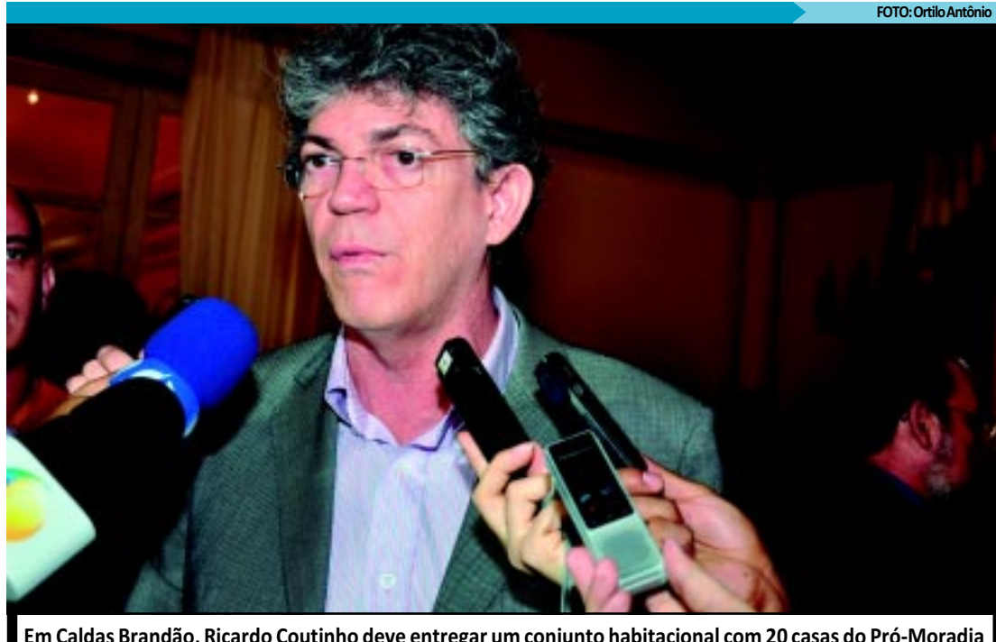
Em Caldas Brandão, Ricardo Coutinho deve entregar um conjunto habitacional com 20 casas do Pró-Moradia

Por volta das 13h30, o governador Ricardo Coutinho vistoria as obras do Binário de Jacumã que estão em fase inicial e devem ser concluídas no segundo semestre do ano. Após conceder entrevista coletiva em Jacumã, Ricardo finaliza as obras do Centro de Convenções, cuja primeira etapa deverá ser entregue no mês de abril.