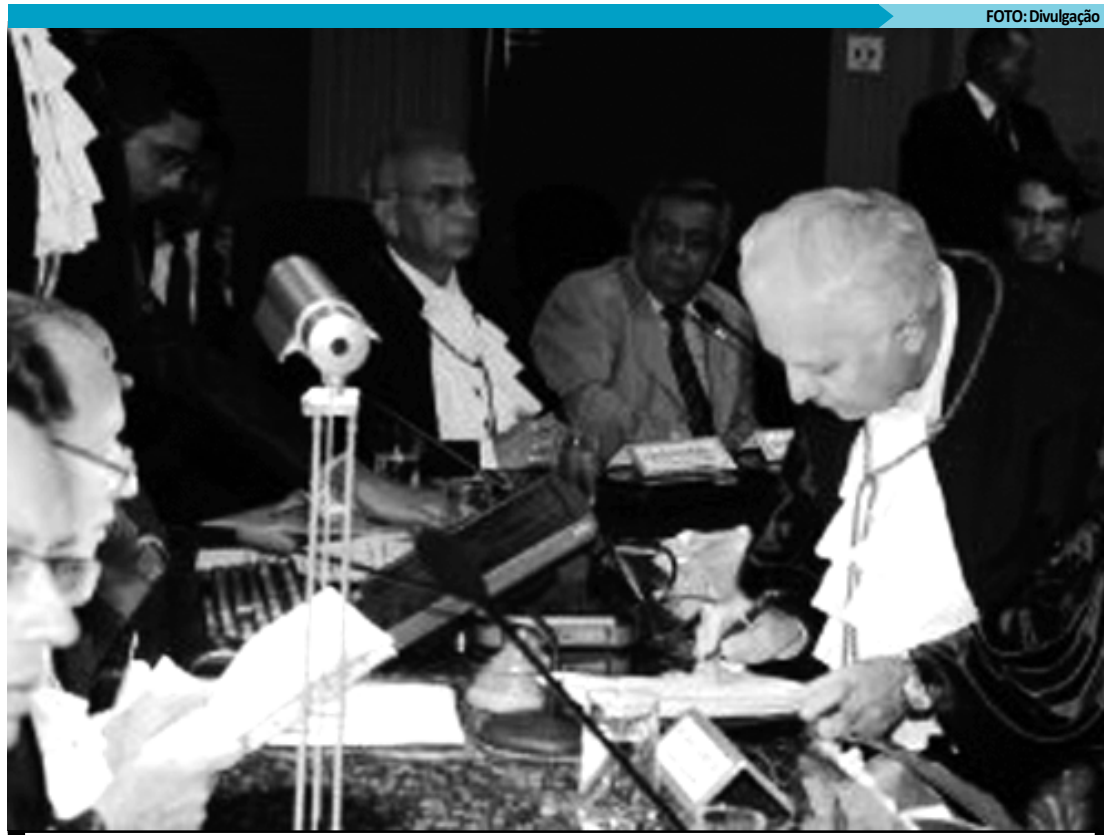
Solenidade de posse foi prestigiada por várias autoridades dos poderes Executivo, Legislativo e Judiciário