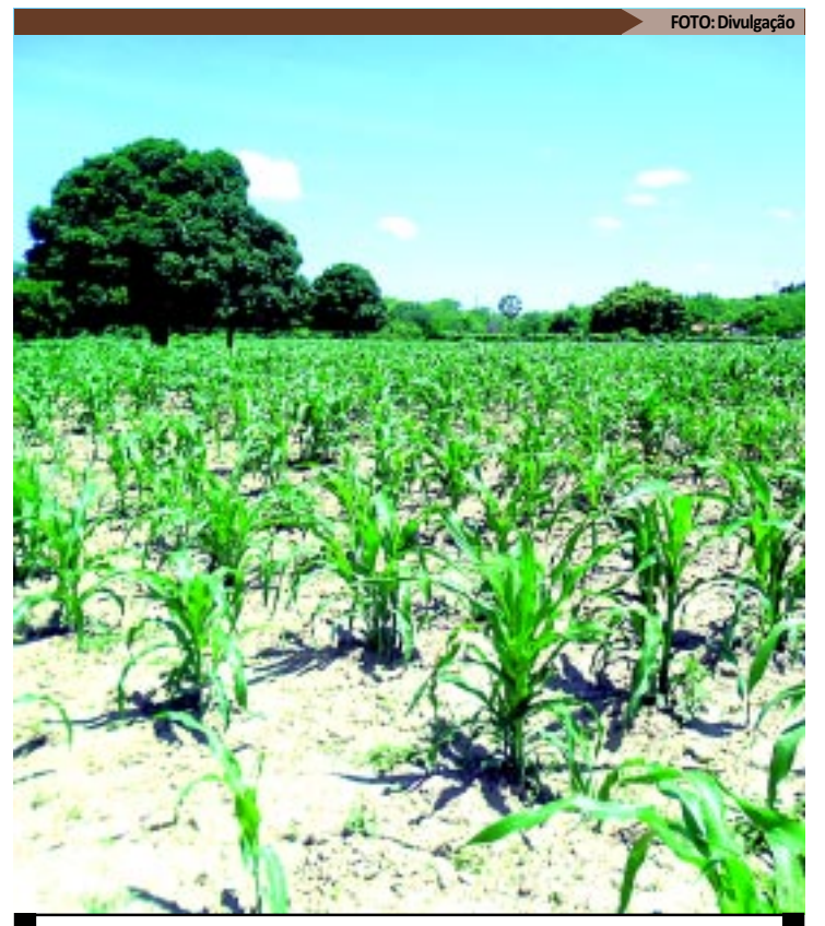
O milho é a cultura de maior representação da safra 2011/2012

PROGRAMA - O programa de distribuição de sementes é gratuito e tem como meta aumentar a renda e inclusão produtiva para o agricultor familiar. Também de fortalecer e apoiar a produção local de sementes. Os beneficiados são agricultores que integram o Programa de Sementes para a Agricultura Familiar, que estão inscritos no programa Garantia-Safra. Em contrapartida, os produtores terão que repassar ao Governo a mesma quantidade de grãos que receberam para assegurar os estoques nos bancos de sementes comunitários.