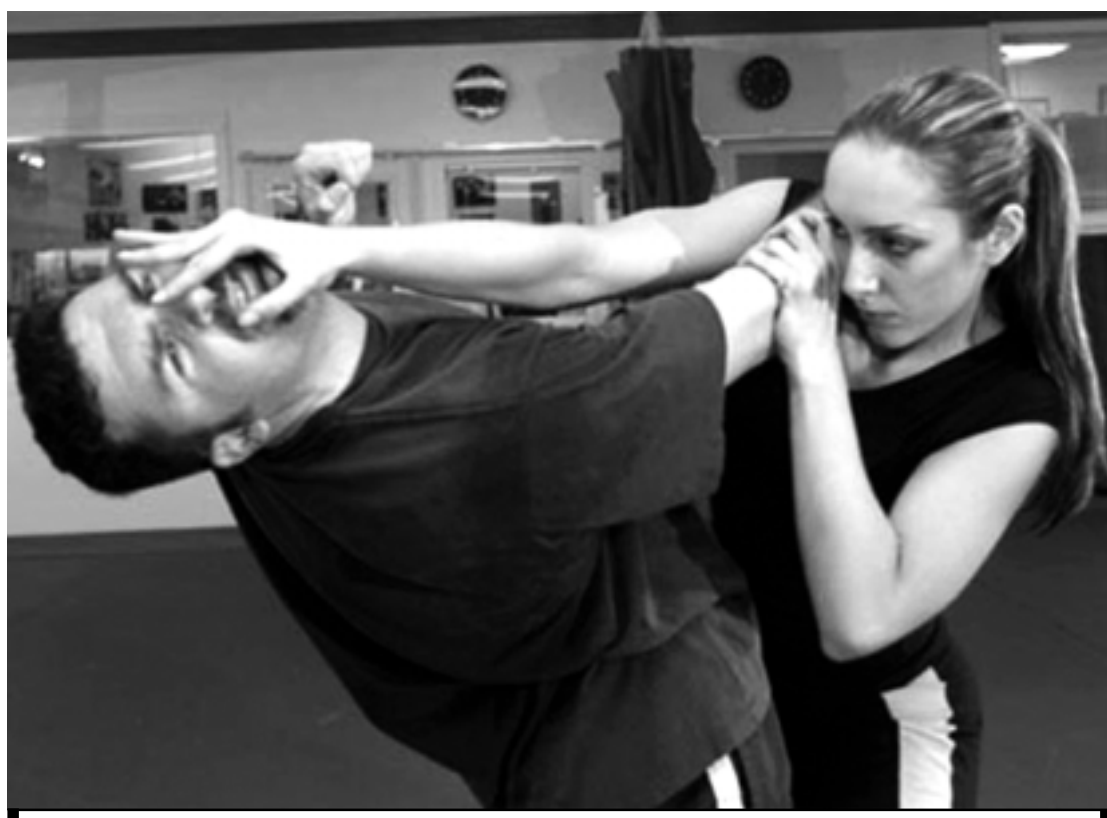
O Krav Magá é muito eficiente como defesa pessoal e vem sendo praticado em larga escala no Brasil