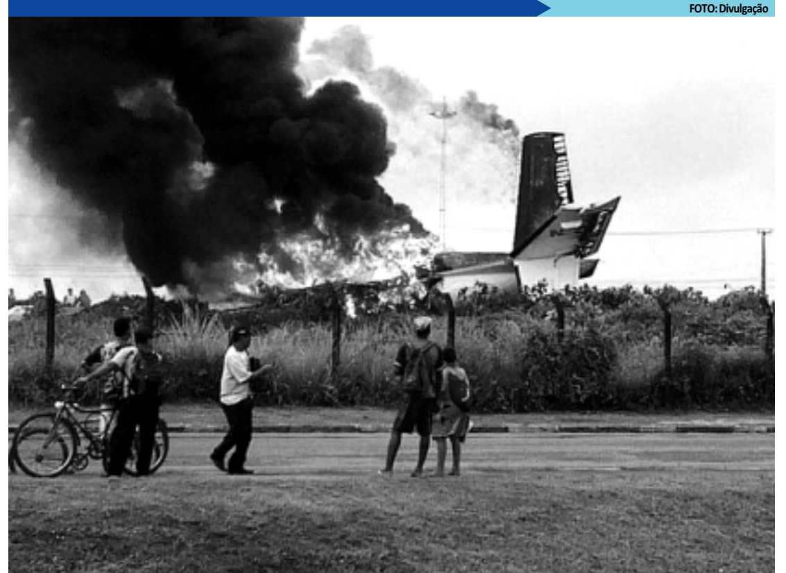
Os dados do Cenipa apontam que 90 pessoas morreram em acidentes aéreos no ano passado, no país

A Anac informou ainda que o aumento em número de ocorrências precisa ser analisado levando em conta o crescimento da frota e os percursos percorridos. “É preciso considerar a variação do volume (de voos), ou